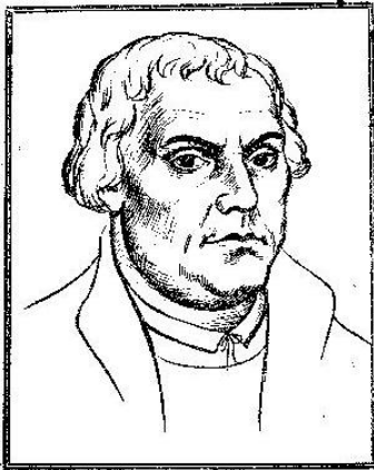
Dr. Luther Márton. Gyoroki Pál festőművész rajza.

A történetírás 1517. október 31-ét tartja a reformáció kezdetének. Akkor szegezte ki Luther a wittenbergi vártemplom kapujára híres, vitaindító 95 tételét. Annak idején Luther Márton és reformátor társai az egyházi élet és tanítás Ige szerinti megújulását kívánták szolgálni. Minden egyházi hagyományt, szokást és tanítást átértékelték az Ige mércéje szerint. A reformáció tehát az Igére figyelést és az ígéhez visszatérést jelenti.